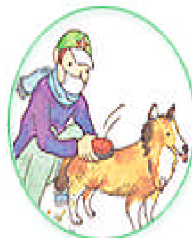
衣類・ペットなどに付着した花粉を室内に持ち込まない