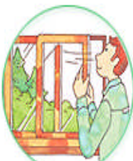
飛散の多い時は、窓や戸を閉めておく