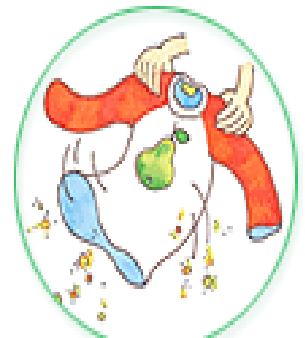
外に干した洗濯物は、花粉をよく落とす