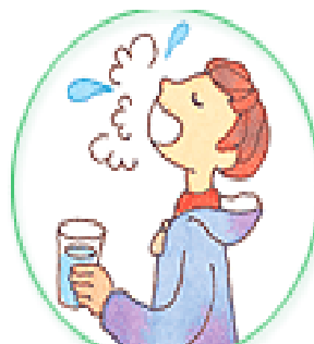
帰宅後は必ず手洗いやうがいを励行