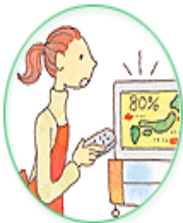
花粉情報に注意し、花粉が多い日の外出はなるべく避ける。